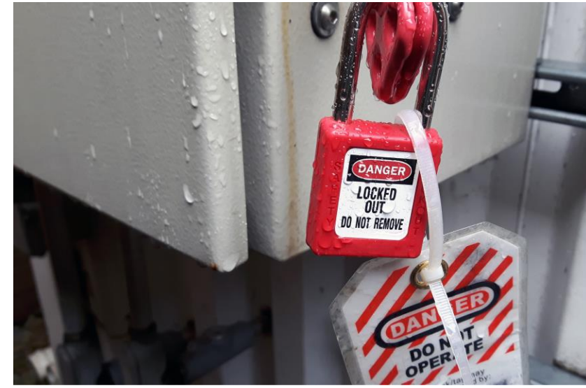
Trabajo con energías peligrosas