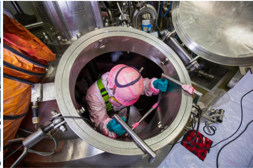
Trabajo en espacios confinados