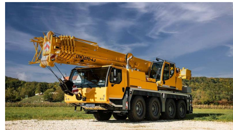
Izaje de cargas