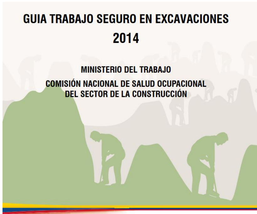
Trabajo en excavaciones

MINISTERIO DEL TRABAJO COMISIÓN NACIONAL DE SALUD OCUPACIONAL DEL SECTOR DE LA CONSTRUCCIÓN