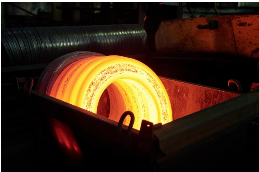
Trabajo en caliente (Soldadura y corte)