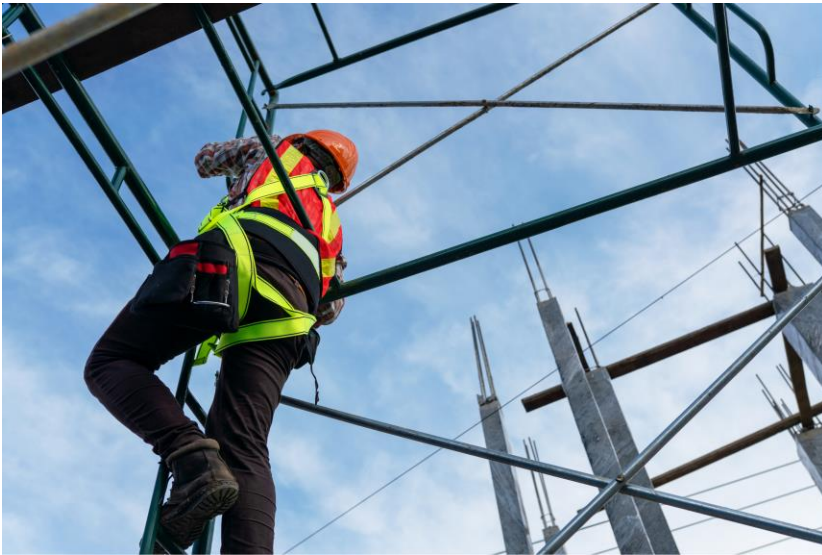
Trabajo en alturas